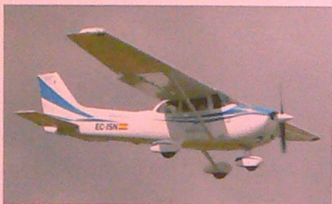
Cessna 172R de l'Aero Club, fent l'aproximació final a l'Aeroport de Sabadell.

L'entitat va rebre un préstec d'1,2 milions de l'Institut Català de Finances, a pagar en 20 anys i amb el qual es va finançar l'operació. Entre finals de l'any 2005 i principis del 2006 es van incorporar quatre Cessna 172R i dues Cessna 172S. Posteriorment van arribar dues Cessna 182T, aquestes últimes equipades amb motors de major potència, per possibilitar que els socis realitzin vols de major durada. Aquests vuit aparells estan equipats amb avionica digital Garmin G1000, la qual cosa ha suposat la introducció de la moderna instrumentació en la flota d'aeronaus de l'entitat i l'adaptació dels pilots al nou sistema de navegació i gestió del vol.