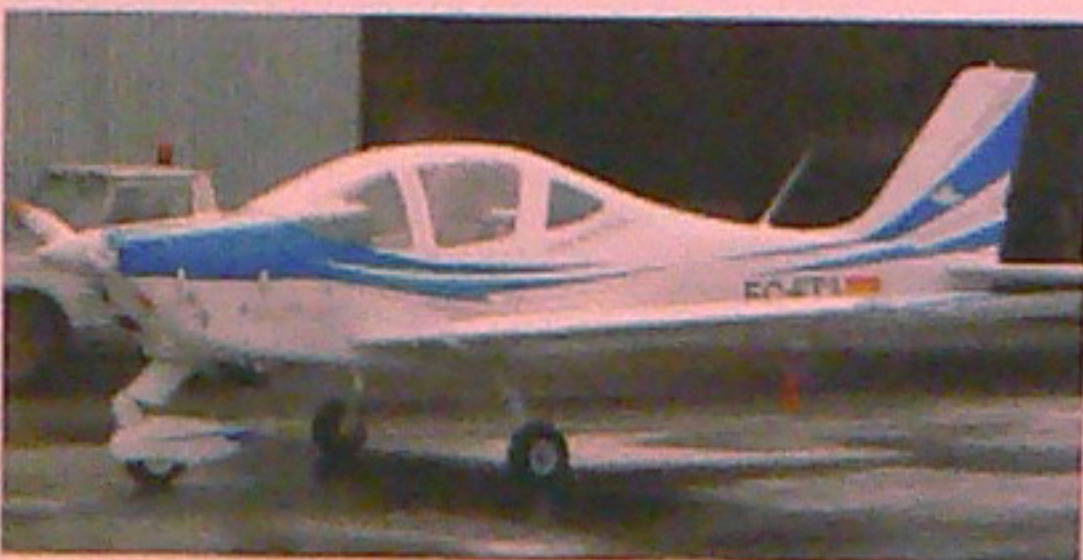
Tecnam P2002 Sierra a l'aeròdrom de La Cerdanya.

Una altra important incorporació ha estat l'arrendament d'un bimotor de quatre places Tecnam P2006T al juny de 2010, la matrícula del qual és EC-LHB i que també té instrumentació digital. L'entitat, que també posseeix dos bimotors -model Piper PA-23-250, i un bimotor Cessna 310, és l'únic aero club d'Europa que compta amb avions bimotors.