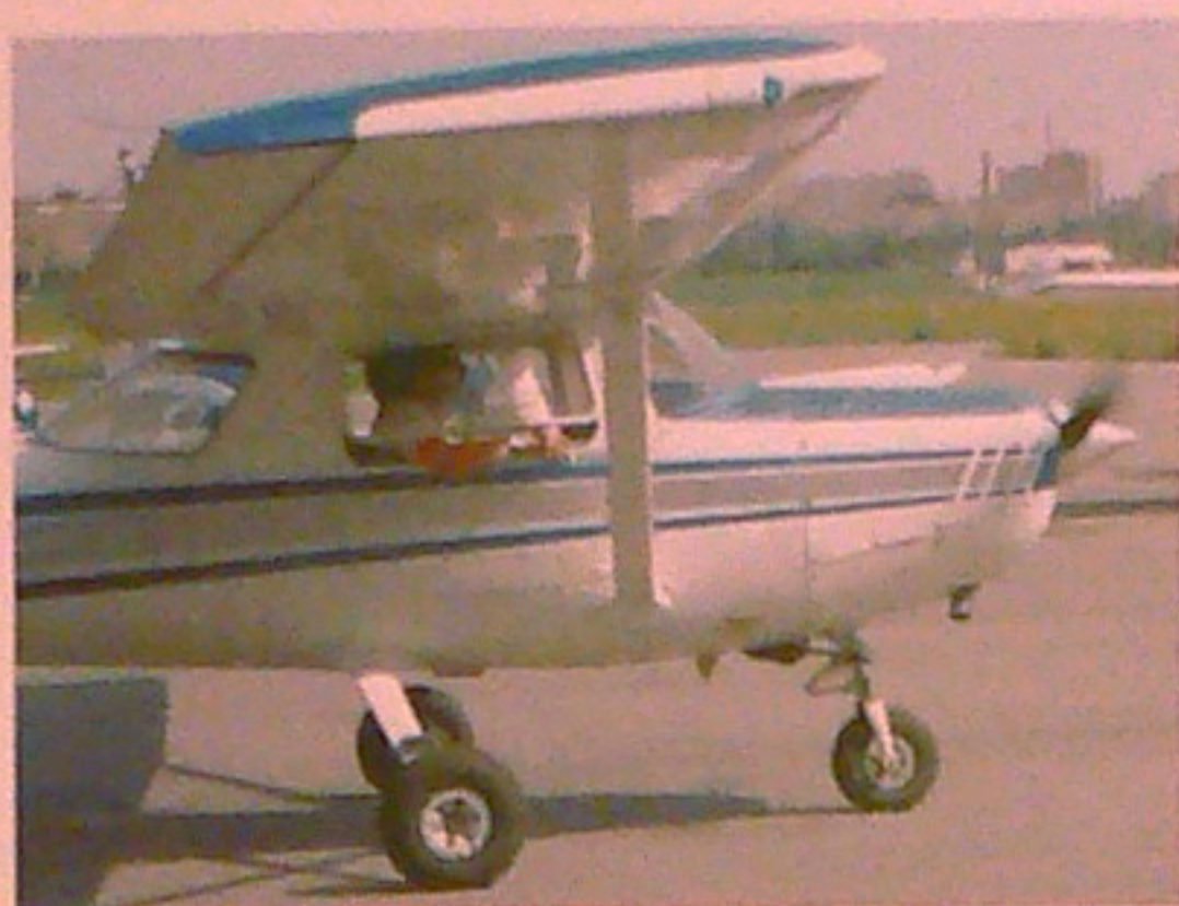
Les Cessna 152, de dues places, són els avions amb els quals els futurs pilots comencen les pràctiques de vol.

A finals dels anys 90 l'Aero Club va consolidar la seva secció d'Helicòpters, ja que aquells anys va tenir tres Robinson R22 amb les matrícules EC-EDH, EC-FQM i EC-FSQ. Des del 2004 es disposa de dos R22.