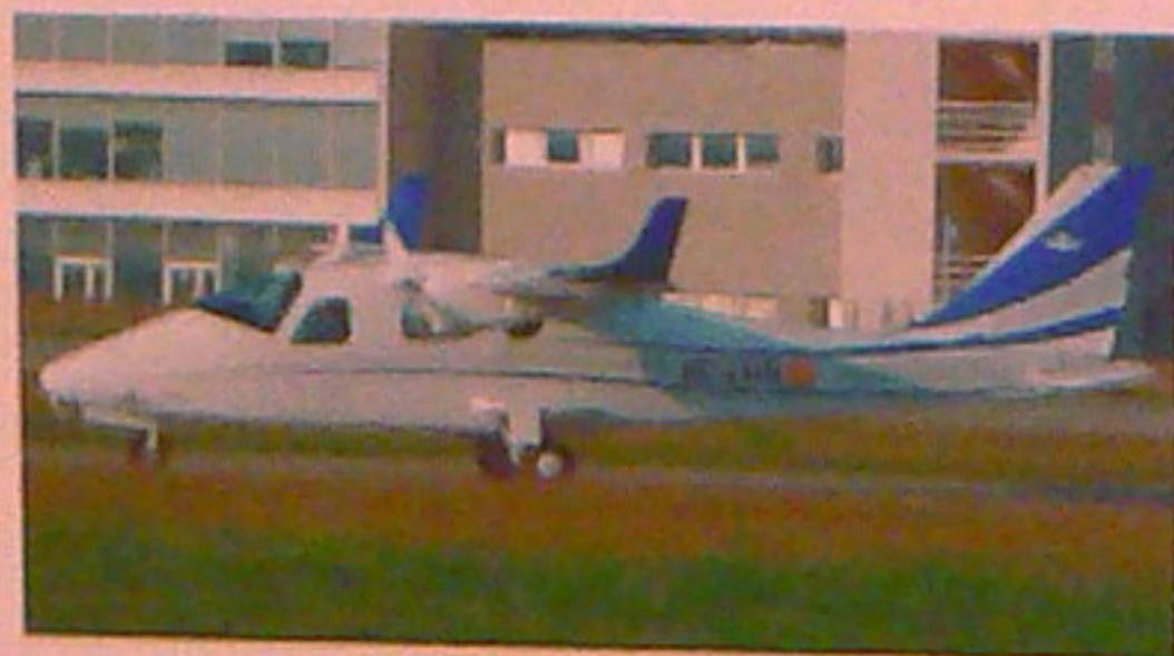
Tecnam P2006T, bimotor lleuger de quatre places.