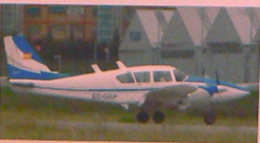
Bimotor Piper PA23-250 Aztec E.

En l'actualitat l'Aero Club Barcelona - Sabadell compta amb 43 aeronaus, la major flota d'un aero club europeu: ultralleuger, monomotors de dues i quatre places, bimotors, planadors d'una i dues places, avions acrobàtics i tres helicòpters. Totes aquestes aeronaus volen en total al voltant d'unes 10.000 hores cada any des de 2007.