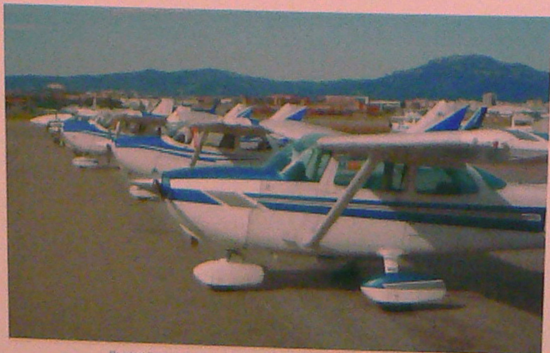
El model Cessna 172 són els més utilitzats pels socis de l'Aero Club.

En l'actualitat l'Aero Club Barcelona - Sabadell compta amb 43 aeronaus, la major flota d'un aero club europeu: ultralleuger, monomotors de dues i quatre places, bimotors, planadors d'una i dues places, avions acrobàtics i tres helicòpters. Totes aquestes aeronaus volen en total al voltant d'unes 10.000 hores cada any des de 2007.