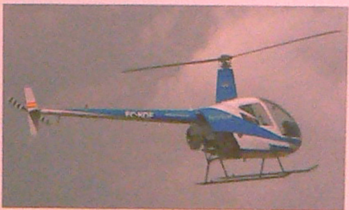
El Robinson R22 (EC-KOF) es va incorporar el 2007.

Posteriorment, el 2009 es va adquirir un ultralleuger Tecnam P2002 Sierra (EC-FT3), equipat amb instrumentació digital i amb el qual es va crear a l'aeròdrom de La Cerdanya la nova secció d'Ultralleugers.